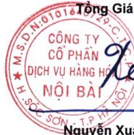
Nguyễn Xuân Phúc